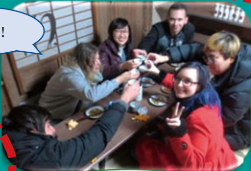
在会场，准备了日本酒、松肉（一种日本特色小吃）、腌菜、味增汤和米饭慰劳大家