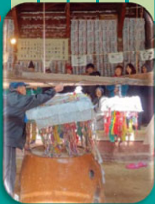
舞蹈结束后，举行诸神归位的仪式。