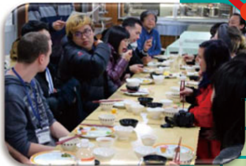
在绿屋小憩，用餐（午餐和晚餐）。