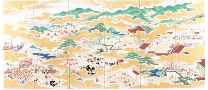
復元本「月次祭礼図屏風」