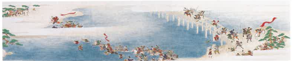
復元本「平家物語下絵小図絵巻」(橋合戦)